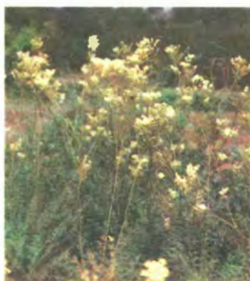
482. Гадючник звичайний.